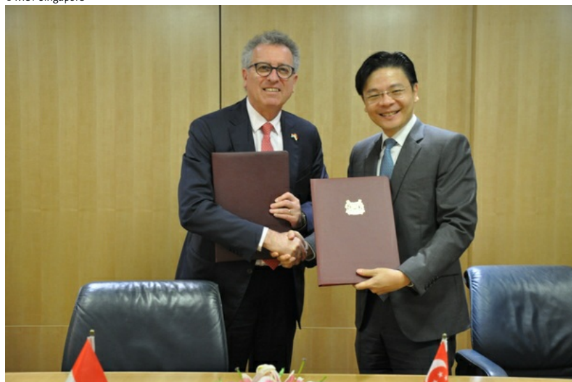
(de g. à dr.) Pierre Gramegna, ministre des Finances; Lawrence Wong, deuxième ministre des Finances de Singapour

Pierre Gramegna, ministre des Finances, s'est rendu à Singapour du 9 au 10 mars 2017, dans le cadre d'une mission ayant pour objet la promotion de la place financière et notamment de l'industrie des fonds d'investissement, ainsi que le renforcement des liens entre nos deux pays.